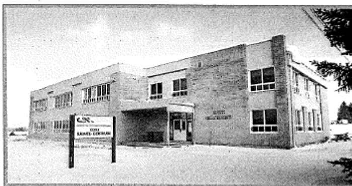
École Ste-Gertrude, 2008

Plusieurs paroissiens ont travaillé à cette construction.