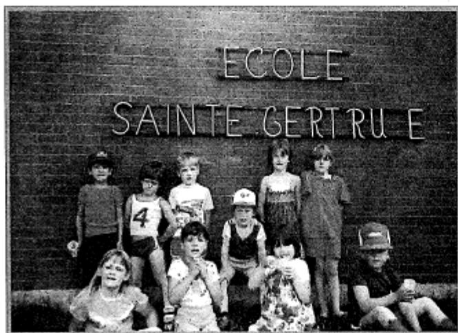
Élèves de l'école Ste-Gertrude

1972—Transfert de la Commission scolaire Ste-Gertrude à la Commission scolaire d'Amos.